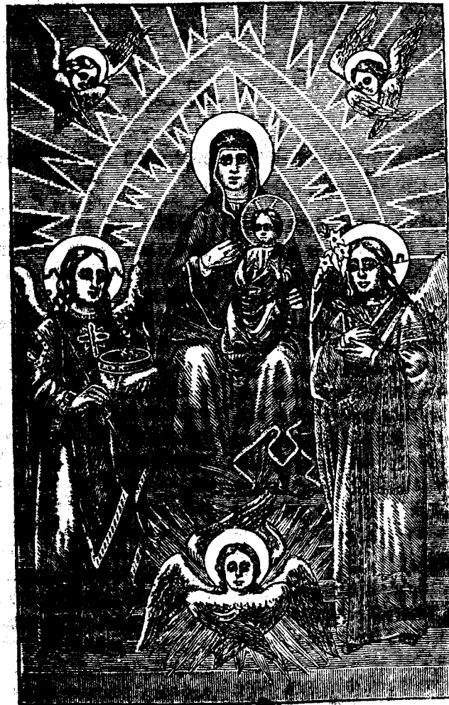
Пречиста Діва. Заступниця Боголюбивої України.

Милосердного Царя мило- сердна Мати, пречиста и бла- гословена, Богородице Маріе! Пролій на мою опановану страстями душу милость Тво-