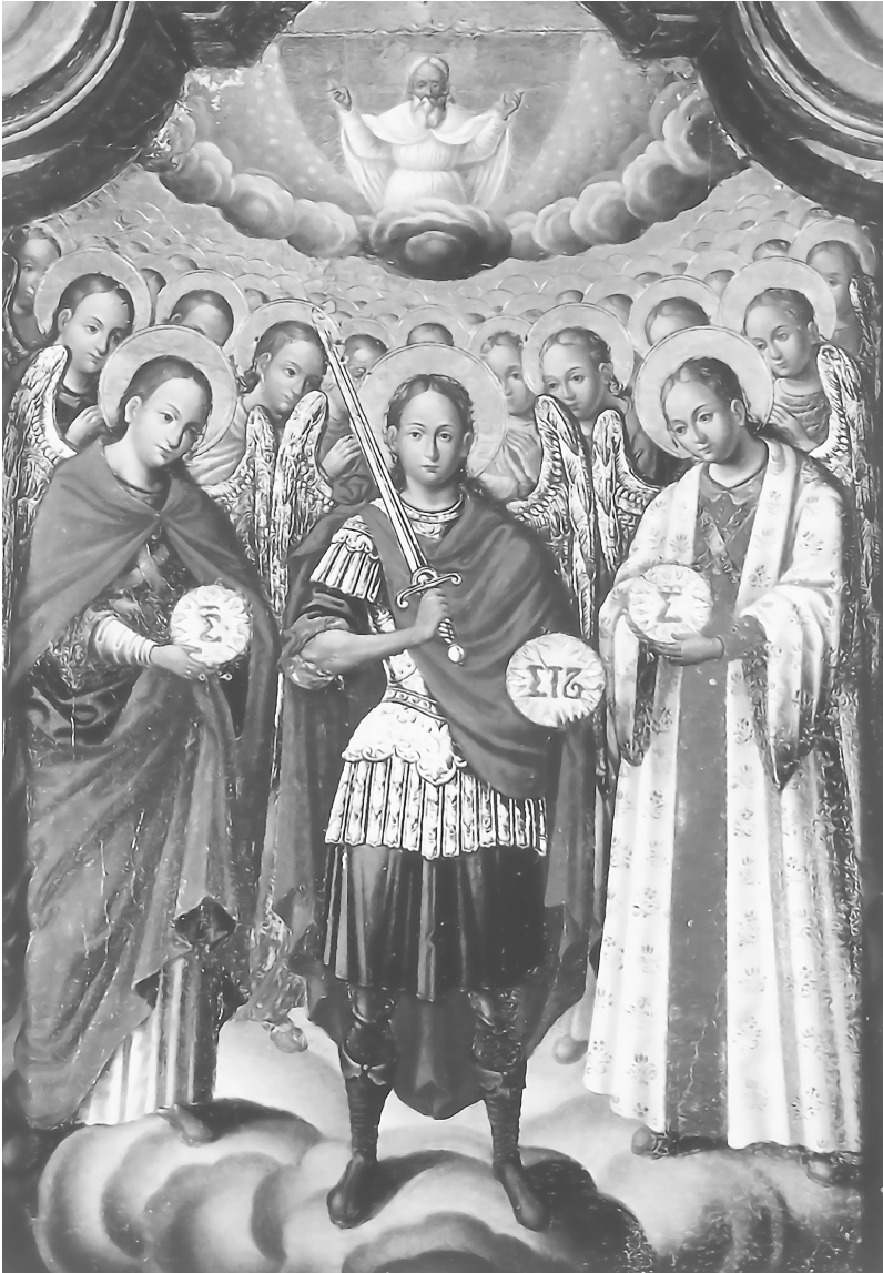
Небесне воїнство під проводом св. Архистратига Михаїла Ікона XVII ст. «Собор св. Арх. Михаїла». Львівщина