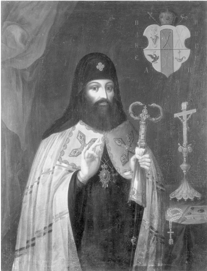
Ікона XVII ст. Автор невідомий